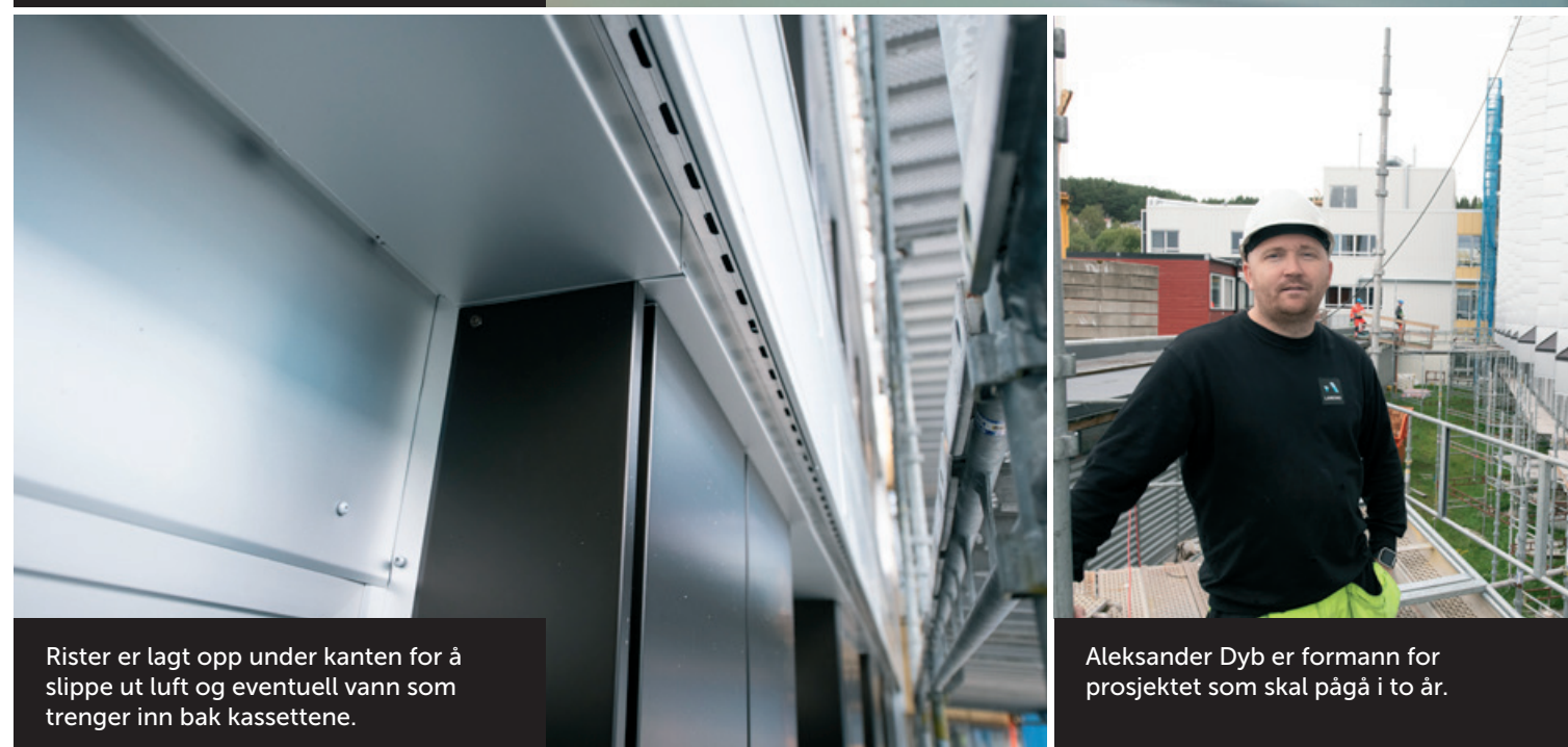
Rister er lagt opp under kanten for å slippe ut luft og eventuell vann som trenger inn bak kassetten.