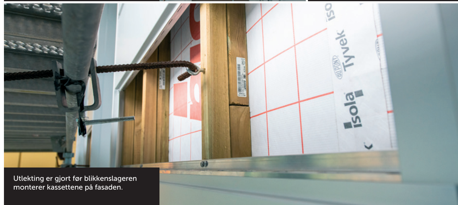
Utlekting er gjort før blikkenslageren monterer kassetten på fasaden.